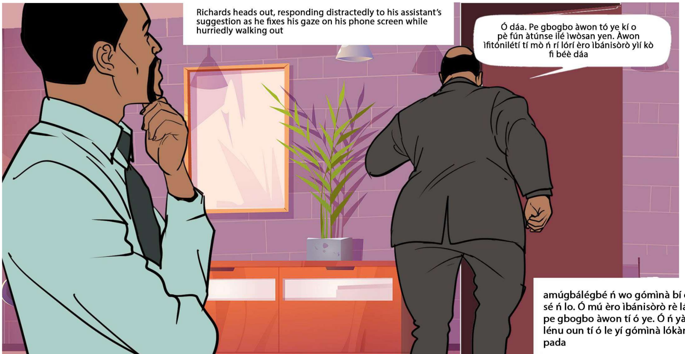
(ó fún-un ní kókóro