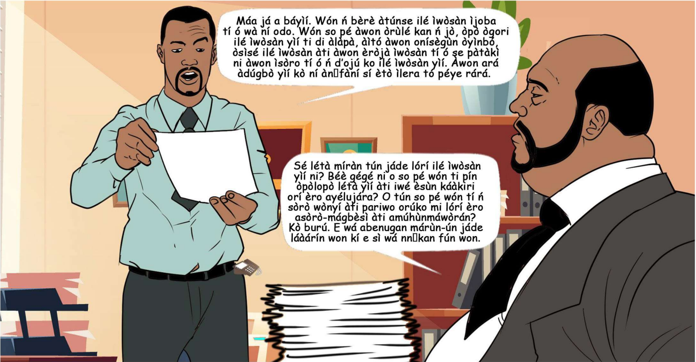
Gómìnà Richards láiwò òke

Máa já a báyí. Wón n bèrè àtúnse ilé iwòsàn ijoba tí ó wà ní odo. Wón so pé àwon òrùlé kan n jò, òpò ògori ilé iwòsàn yí ti di àlápá, àlò àwon onísègùn òyinbò, òsísé ilé iwòsàn àti àwon èròjà iwòsàn tí ó se pàtàkì ni àwon Isòro tí ó n d'ojú ko ilé iwòsàn yí. Àwon ará àdúgbò yí kò ní ànlfàní sí ètò ilera tó péye rará.